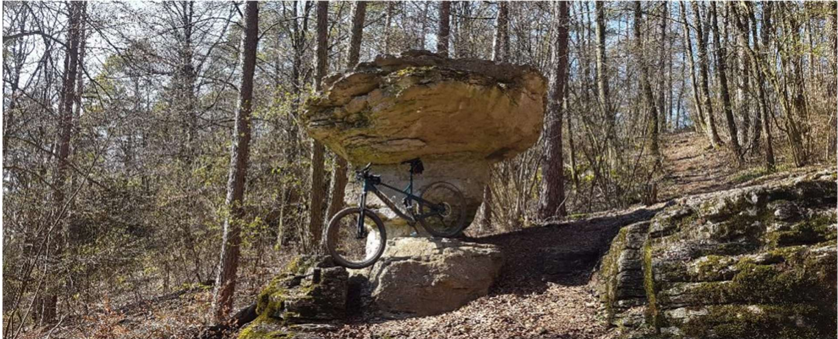
Der Teufelstisch – umgeben von unzähligen Trails und Naturspektakeln

Kurzweilige, mittelschwere MTB Tagestour mit handverlesenen, flüssigen Trails und Einkehr in die Klosterwirtschaft der Brauerei Weißenhohe.